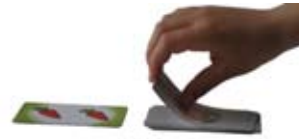
Käännä kortit näin!

Virheistä sakottaminen voi olla liian vaikeaa, jos pelissä on mukana pikkulapsia. Päättäkää säännöt, ennen kuin aloitatte pelaamisen!